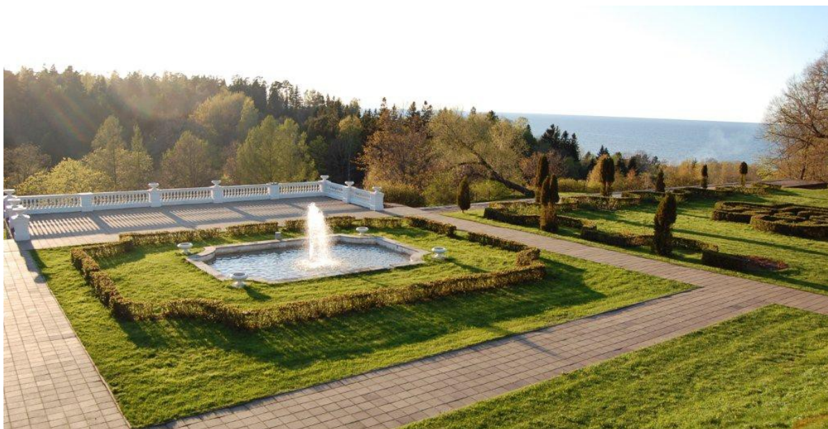
Pilt: Oru park