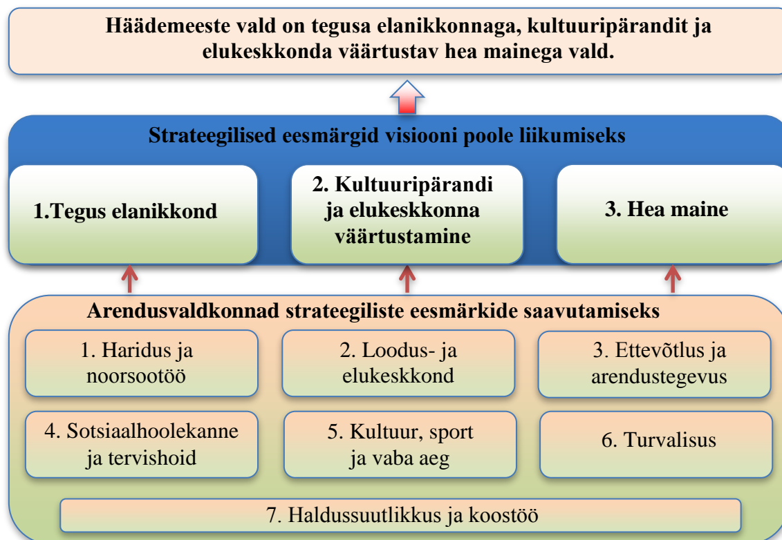
Joonis 1. Häädemeeste valla arengumudel

Häädemeeste valla arengumudel illustreerib seda, millised on strateegilised eesmärgid visiooni poole liikumiseks ja millega tuleb tegeleda strateegiliste eesmärkide saavutamiseks.