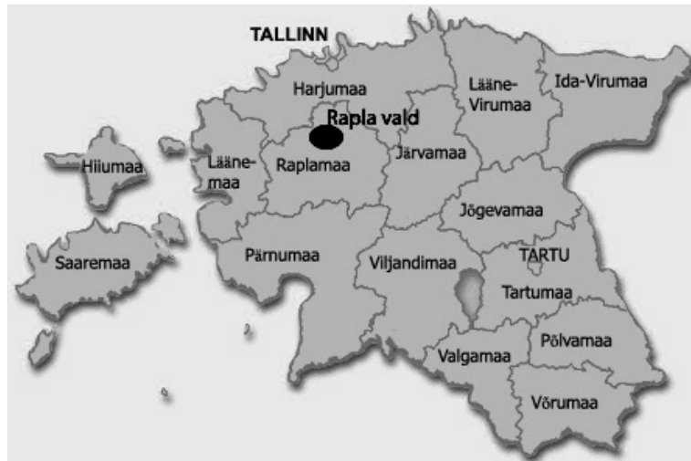
Joonis 1. Rapla valla asukoht Eestis.