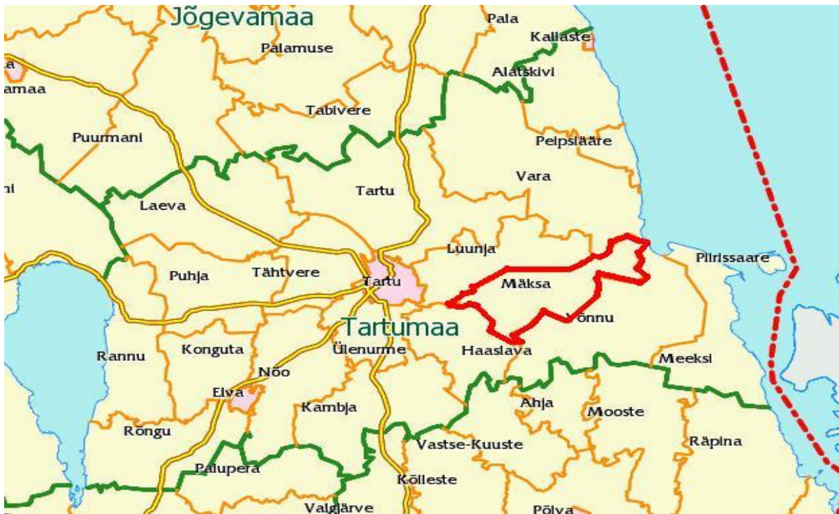
Joonis 2. Mäksa valla paiknemine Tartumaal

Mäksa vald paikneb Tartu maakonnas, asudes Tartu linnast kagu suunas ja Peipsi järvest idas. Mäksa valla keskus asub Tartust 17 km kaugusel.