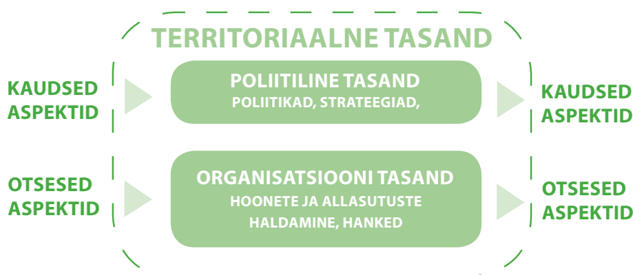
Joonis 3. Avaliku sektori toimimise tasandid

KKJS-i käsitlusala ja ulatust täpsustatakse tavaliselt esmase keskkonnaülevaatus e käigus.