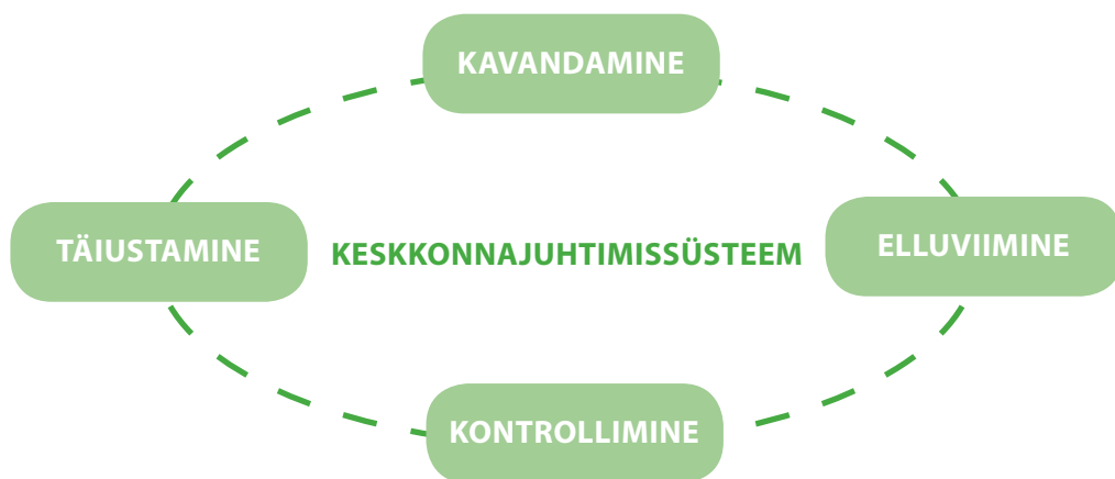
Joonis 1. Keskkonnajuhtimissüsteemi põhielemendid (Demingi ring)

Kõikide juhtimissüsteemide ülesehitus sisaldab üldjuhul ühiseid põhielemente, mis on omased süsteemsele juhtimisele. Nii on ka keskkonnajuhtimise aluseks nn Demingi ringi mudel ( the Deming circle ), mis toetab süstemaatilist lähenemisviisi tegevuste/protsesside pideval parandamisel ja meetmete rakendamisel (