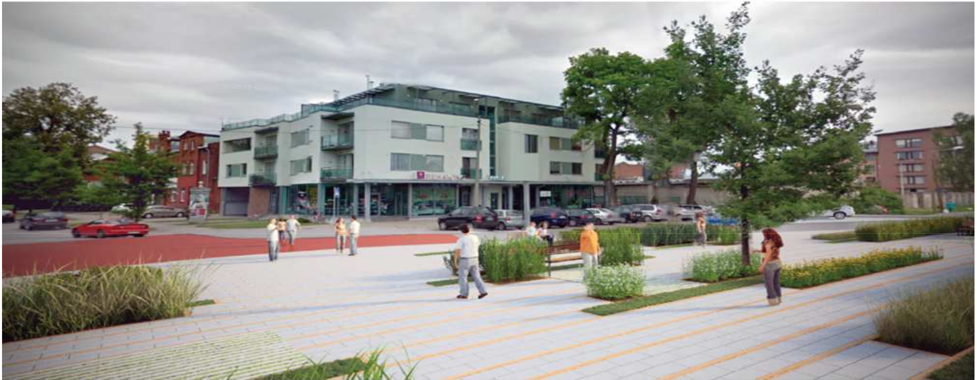
ULAL: VAADE II ALL: DETAILED VAATED