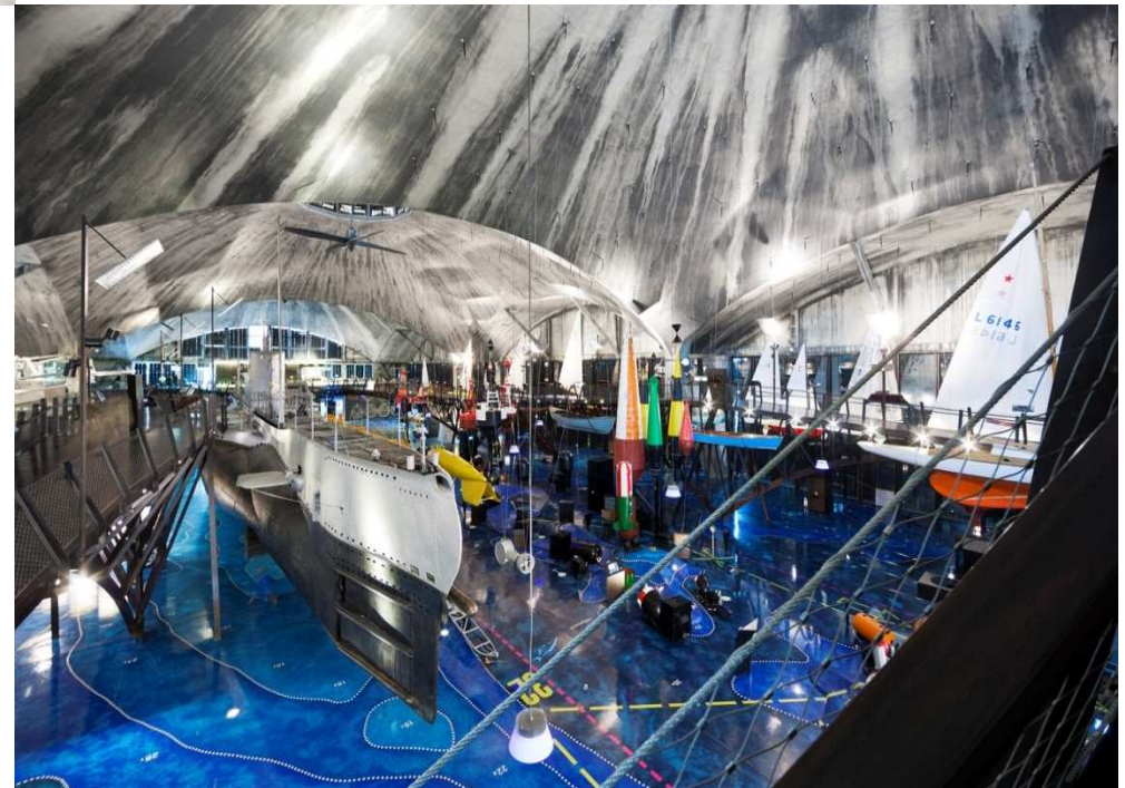
Meremuuseumi Lennusadam (Euroopa Regionaalarengu Fondi toetus 9,1 milj eurot) 322 000 külastajat 2014. aastal