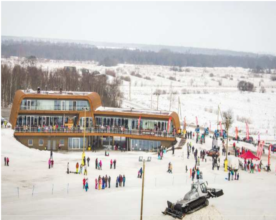
Kiviõli Seiklusturismi keskus (Euroopa Regionaalarengu Fondi toetus 3 milj eurot) Eesti parim turismiobjekt 2013